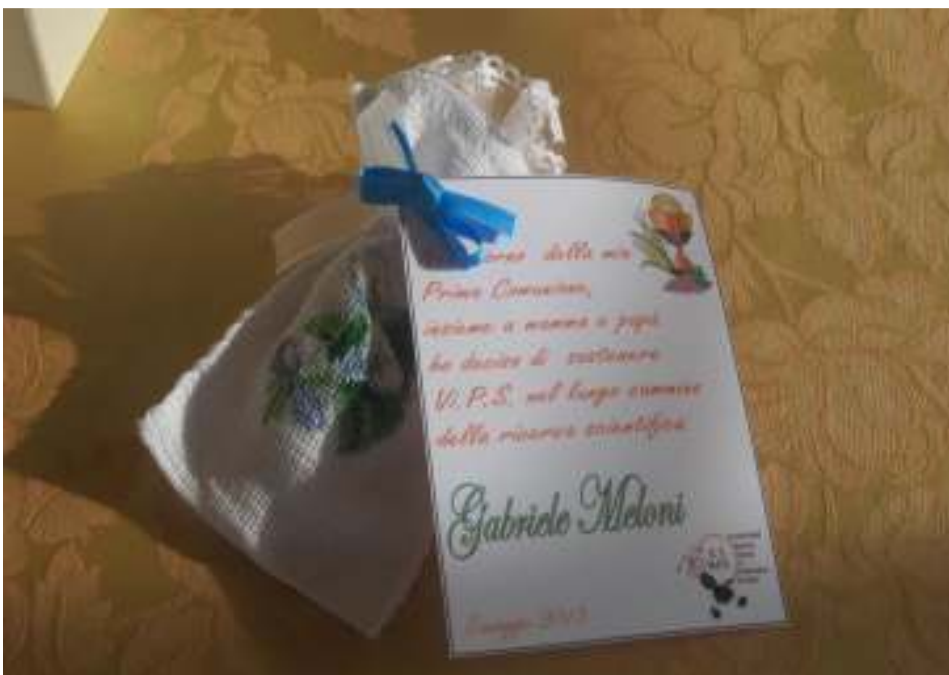
Bomboniere per Comunione