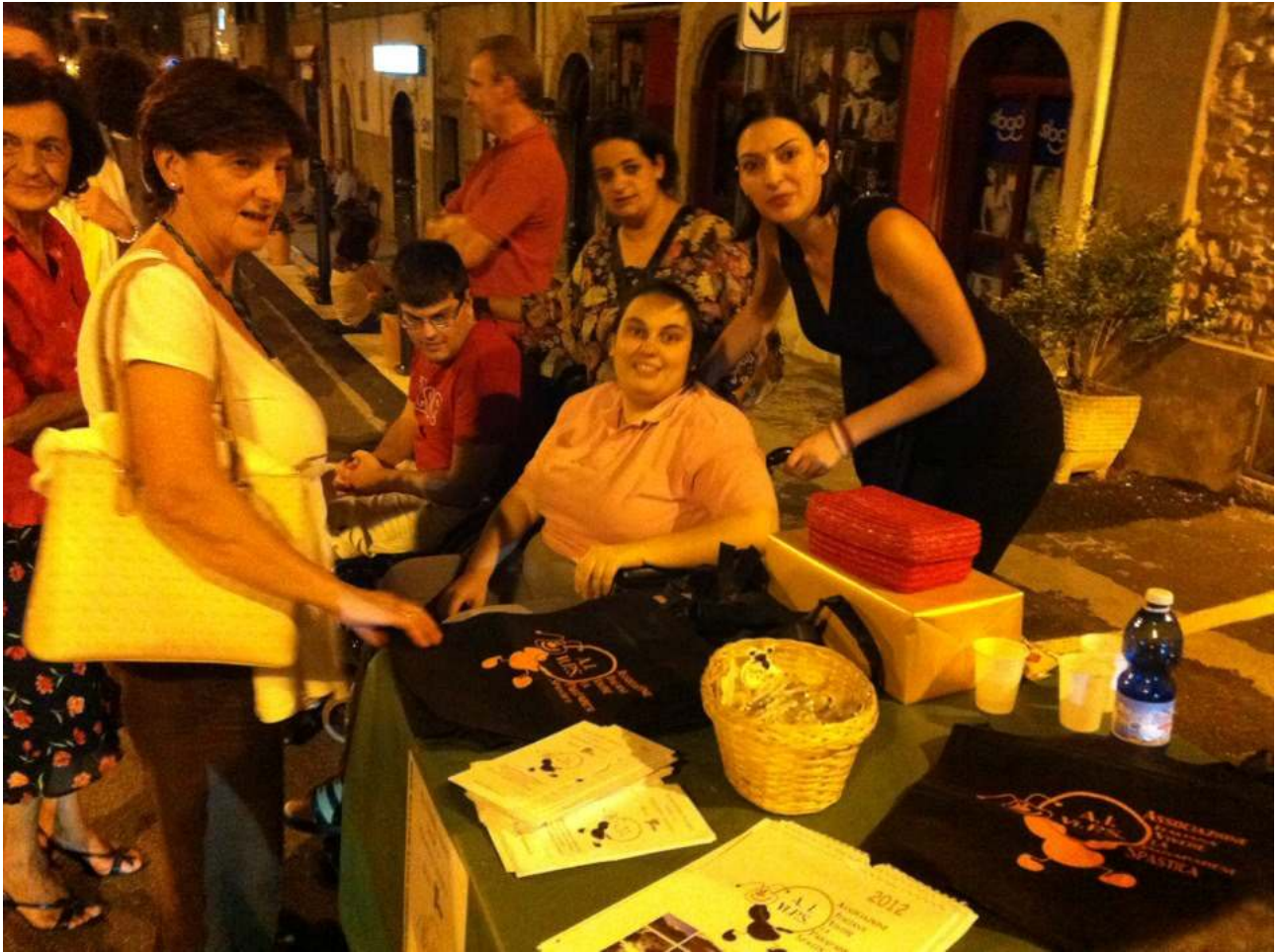
Santa Maria De Mattias ad Acuto (FR)