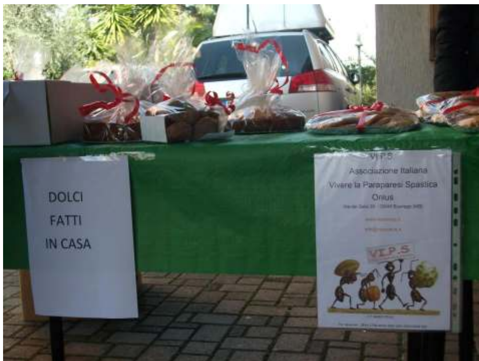
Raccolta fondi presso la Parrocchia S.M. Domenica Mazzarello