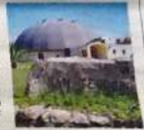
San Teodoro il teatro comunale

tore Artistico della "Music Lab School: Progetto Musica & Incontro", annunceranno l'imminente apertura della scuola di musica a San Teodoro. Una realtà nascente rivela la sala a chi vuole appropinquarsi alla materia in modo amatoriale, sia per quelli che vogliono intraprendere uno studio accademico o professionale. I corsi della Music Lab School sono: pianoforte, chitarra moderna, basso elettrico, batteria e percussioni, corno, violino, musica di insieme per band (info: 348.927321).